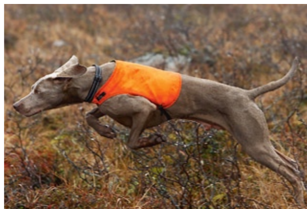
VARANEN MAJVOR var i alla fall snabb.

Till ripjakt är öppen borring att rekommendera och hagelstorlek US 6-7 för blyhagel och US 4-5 för stålhagel.