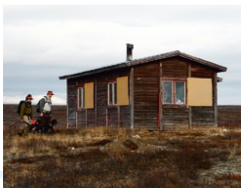
MITT PÅ FJÄLLTUNDRAN står renvaktarstugan i Navdegielas.

Det finns massor med experter när det gäller jakt. De har exakta teorier om hur viltet uppträder i olika väderförhållanden. Men ibland stämmer inga uträkningar och ändå kan det bli en lyckad jakt.