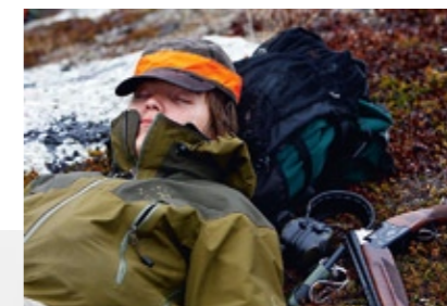
VI HADE INTE GÅTT LÅNGT förrän Kylmä krävde rast och vila.

”Sedan kan man plocka riporna som hjortron”