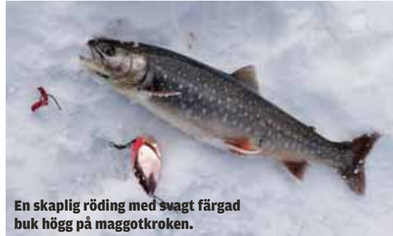
En skaplig röding med svagt färgad buk högg på maggotkroken.