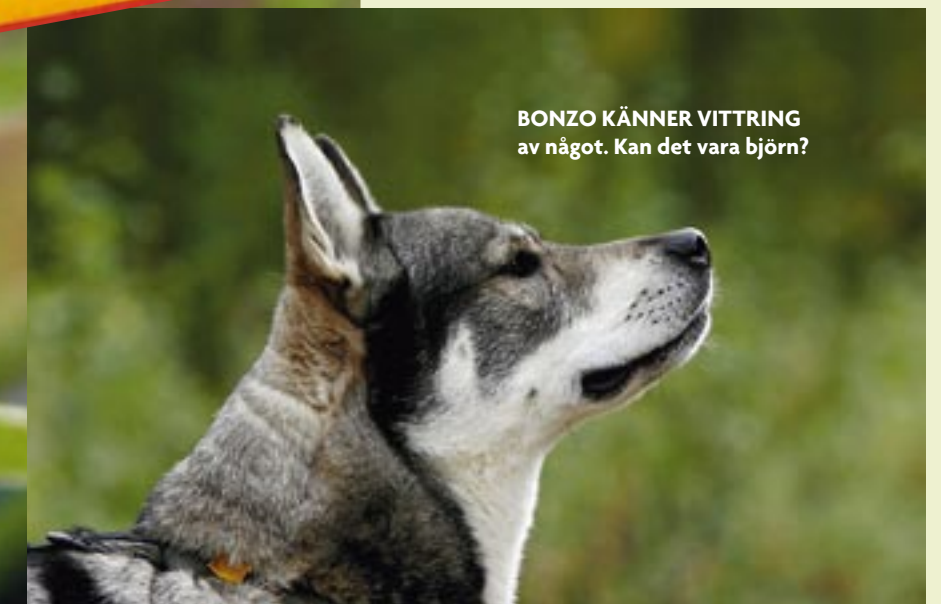
BONZO KÄNNER VITTRING av något. Kan det vara björn?