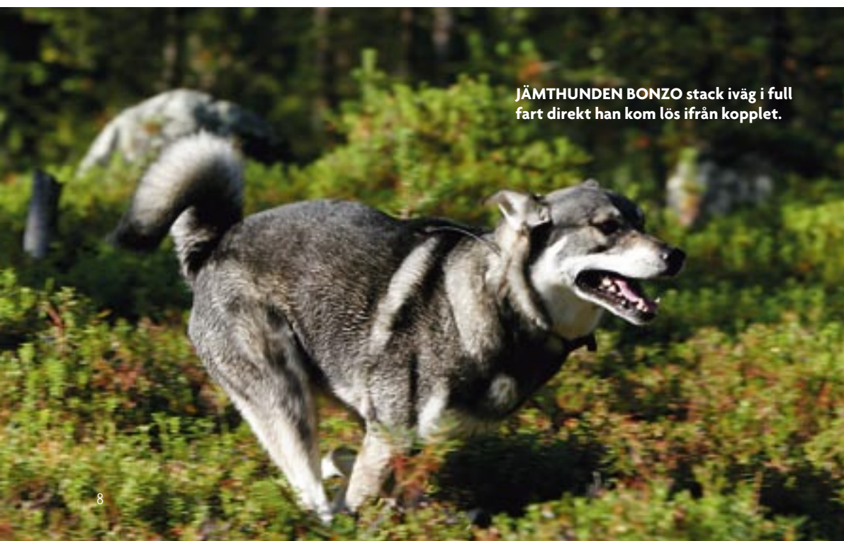
JÄMTHUNDEN BONZO stack iväg i full fart direkt han kom lös ifrån kopplet.