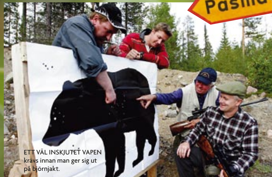
ETT VÄL INSKJUTET VAPEN krävs innan man ger sig ut på björnjakt.