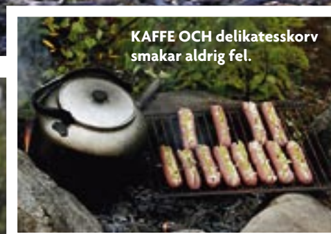
KAFFE OCH delikatesskorv smakar aldrig fel.